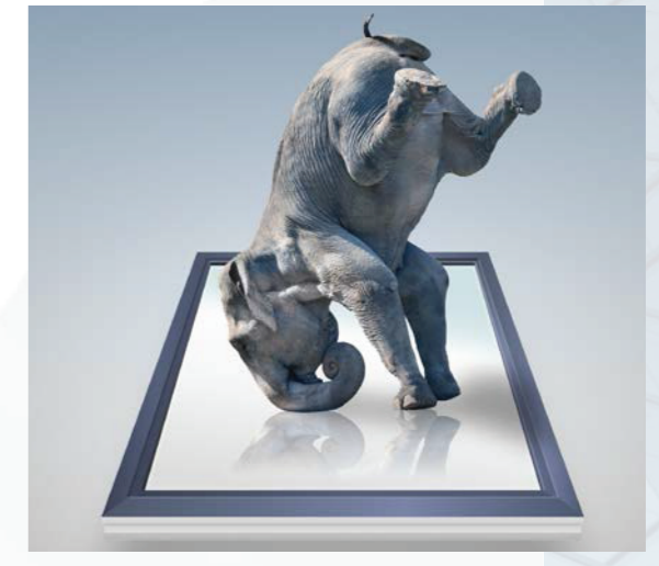
Statics at the highest level