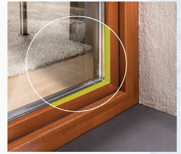
Statické zasklenie na sucho STV®